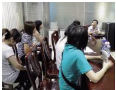
7月13-15日，电召台特组织员工到禅城鸿运出租电召台学习取经。