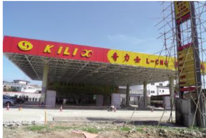
奇力士加气站工程已完成，正接受有关部门的验收。

第一站是参观位于金沙大道的顺风加气站。记者现场看到该气站的建设已经进入收尾阶段，土建工程已经差不多完成。据该气站相关负责人介绍，该站将会兴建4台CNG加气机、八支加气枪，日均最高加气量可达2万立方，按照平均每台车一天消耗13立方计算，足够满足加气需求。据了解，该气站原本预计是7月份完成建设的，但由于近1个月来，就有10多天下大雨，影响了气站的施工进度。为了能让气站尽快投入使用，该气站的建设人员已经加班加点、按质按量的加快工程进度。“由于气站建设有着其特殊性，对安全性要求特别高，所以在气站建成后，还需要对设备进行检测，并通过有关部门的验收。”顺风气站负责人介绍说，该站土建工程将在几天内结束，目前正在加紧安装设备，应该很快可以投入使用。