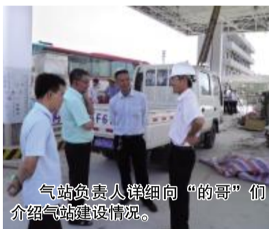
气站负责人详细向“的哥”们介绍气站建设情况。

参观过程中，“的哥”在加气站边走边看，边走边问，在亲自获得加气站负责人的解答之后，他们才打消了疑虑，也为不久的将来不用排长队