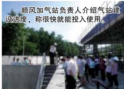
顺风加气站负责人介绍气站建设进度，称很快就能投入使用。

针对众多“的哥”所反应的“加气难”问题，8月3日上午，顺德区环境运输和城市管理局与顺德出租车协会特组织三家出租车运营单位的30多名“的哥”参观了顺德在建的3座新气站，了解其工程进度。