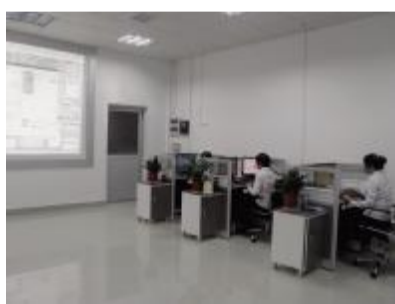
在光洁明亮的电召室里，员工正通过系统为市民寻找出租车。

“电召系统正处于升级换代中，新的系统将会在不久的将来上线，现在我们都忙与协调新旧系统的接合和