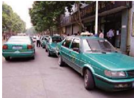
▲破旧“绿的”显然已经不符合顺德的城市形象，速度淘汰“绿的”是顺德出租车行业发展的必然结果。

顺德最后 23 台“绿的”退出营运，被网友戏称为“全国最差”的“绿的”在顺德已成为历史，留下的全是公司化经营的天蓝色的士。“绿的”再在路面上载客，就属于非法营运。