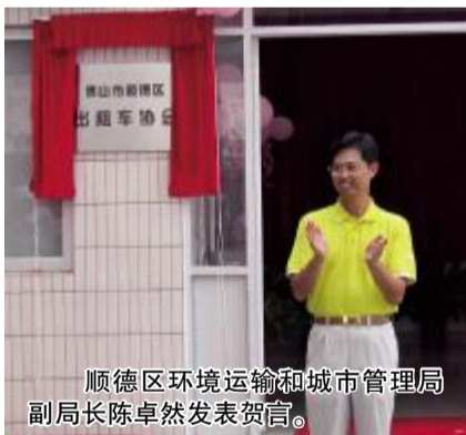
顺德区环境运输和城市管理局副局长陈卓然发表贺词。