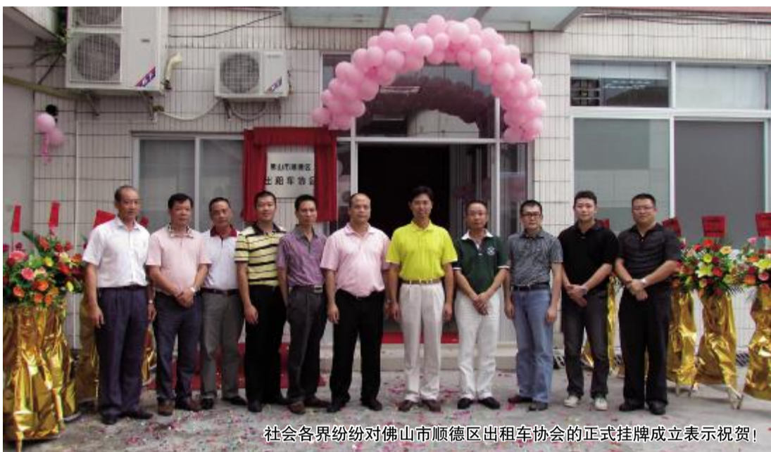
社会各界纷纷对佛山市顺德区出租车协会的正式挂牌成立表示祝贺！