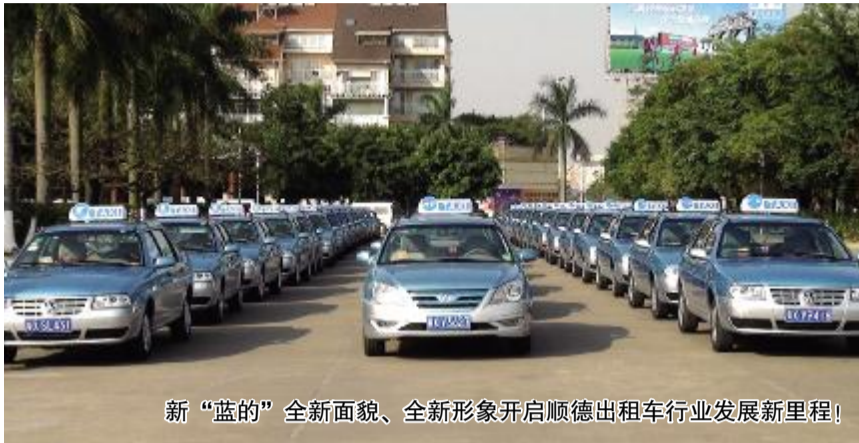
新“蓝的”全新面貌、全新形象开启顺德出租车行业发展新里程!