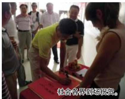
社会各界到场祝贺。