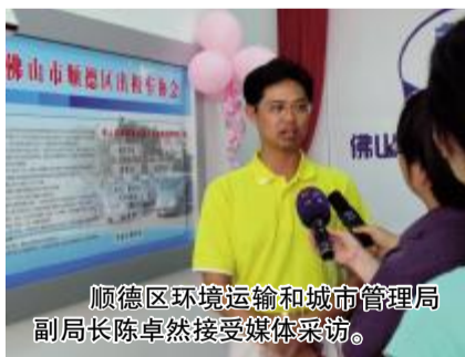
顺德区环境运输和城市管理局副局长陈卓然接受媒体采访。